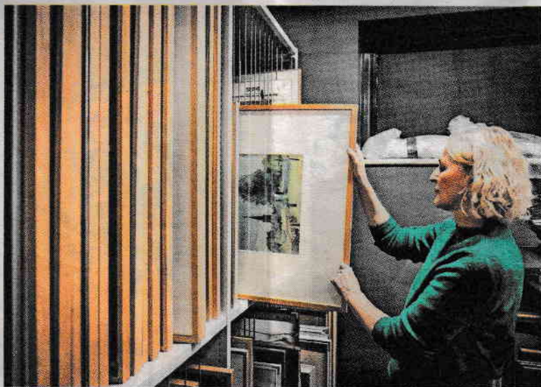
▲ In het 'gesloten depot' in de kelder van het RAADhuis liggen nog vele werken te wachten op een bestemming.

Wie is de grootste kunstbezitter van Meierijstad? De gemeente zelf! Met zo'n negenhonderd gekregen en zelf aangekochte kunstwerken. Maar waar moet je die allemaal laten? Hoogste tijd voor een opschoonbeurt.