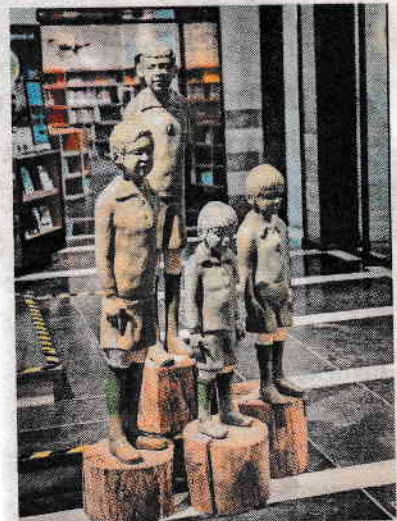
▲ ▼ Enkele van de kunstwerken in het RAADhuis in Schijndel.